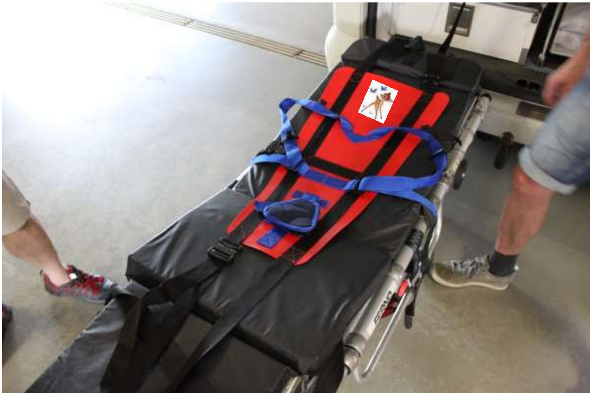
Kind, 7 Wochen alt, Körpergröße 50 cm